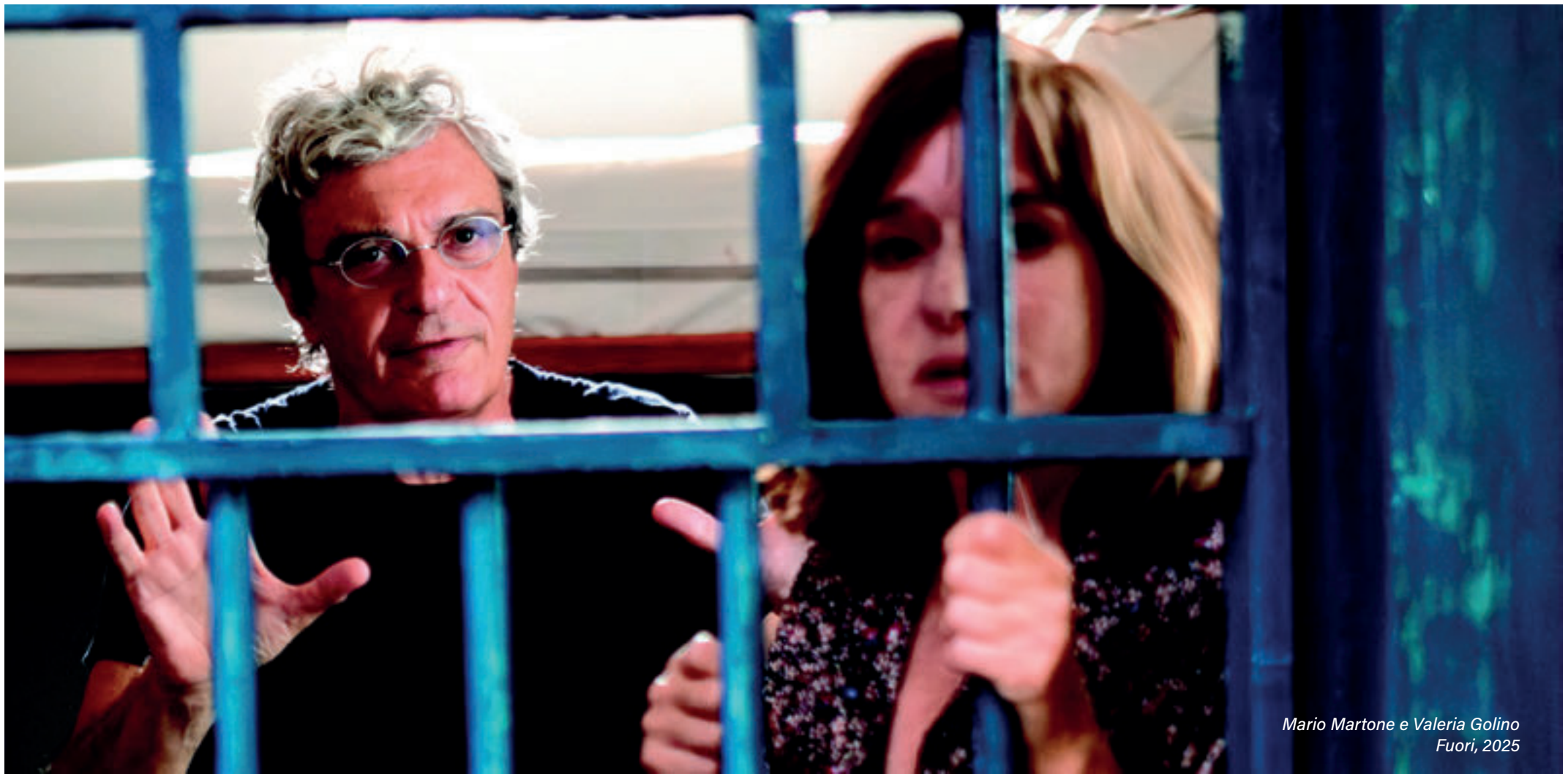
Mario Martone e Valeria Golino Fuori , 2025