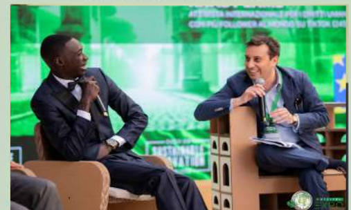
CENA NETWORKING B2B e B2G