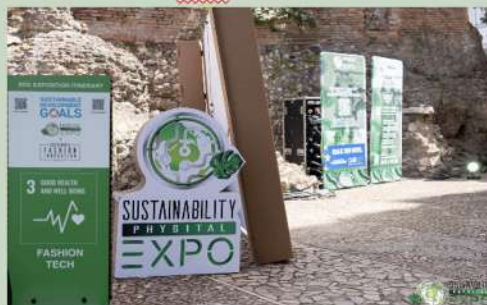
SFILATA NARRATA® NEI FORI IMPERIALI