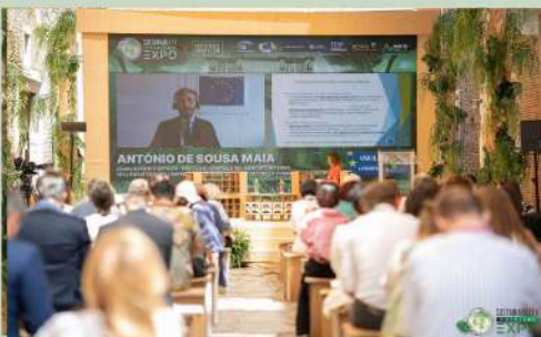
PERCORSO NEGLI SDGs DELL'AGENDA ONU 2030