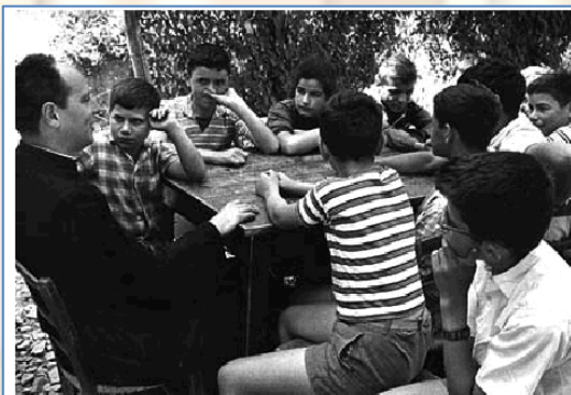
Don Milani con i suoi ragazzi a Barbiana.