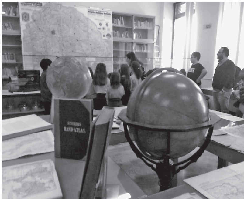
Fig. 2. Esperienza didattica effettuata durante la prima Notte Europea della Geografia in Sapienza

La fase di strutturazione e di proposta delle esperienze didattiche è stata avviata in occasione della prima edizione della Notte Europea della Geografia (aprile 2018) e da allora prosegue con continuità 3 , arricchita nell'anno accademico/scolastico 2019/2020 da un'esperienza di Percorsi per le competenze trasversali e per l'orientamento (PCTO) per studenti della scuola secondaria di secondo grado (Partecipazione e beni territoriali comuni: patrimonializzazione dei beni dell'istituto Museo di Geografia) e saranno sicuramente ampliate anche mediante processi partecipativi e tramite incontri periodici e simulazioni laboratoriali per verificare il grado di apprezzamento ed eventualmente ricalibrare i contenuti (Huixian Lin, 2011).