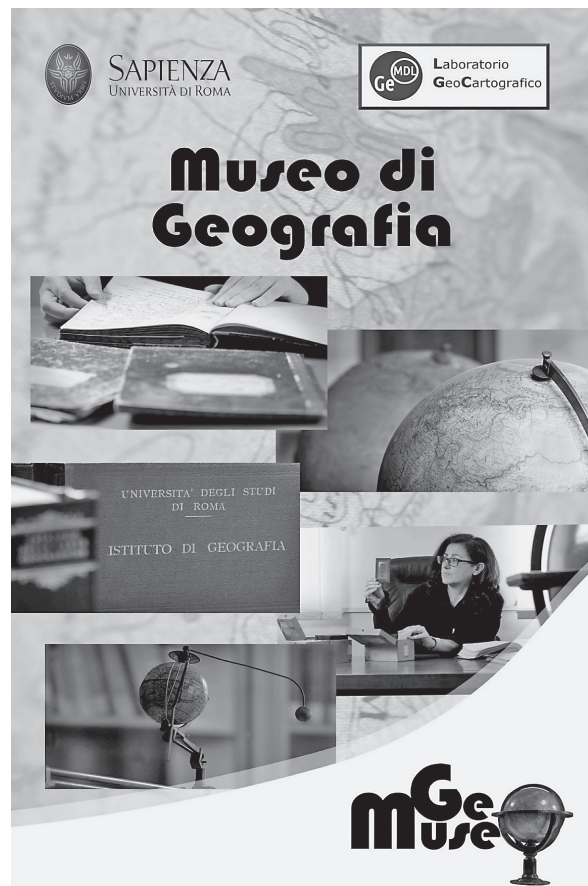
Fig. 3. Locandina del neo costituendo Museo

La dimensione multisensoriale data alla realizzazione del progetto museale non rappresenta una semplice appendice integrativa di museo tra-